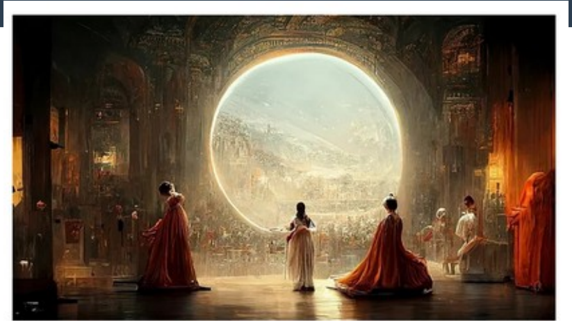
Théâtre d'Opéra spatial © Jason M. Allen par Midjourney