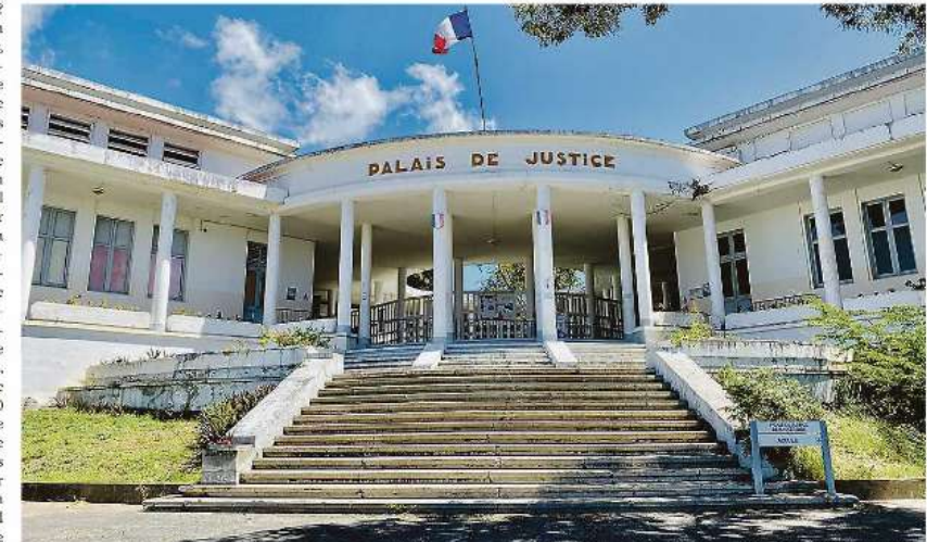
L'accusé a souhaité faire appel de sa condamnation en 1ère instance, d'où l'ouverture de son procès, ce matin.

Le médecin légiste relevait 4 plaies données à l'arme blanche, dont une avait été mortelle. Pour ses amis et sa famille, la défunte est qualifiée de femme de caractère, dynamique, travailleuse et réservée. L'audition du voisinage n'apportait aucun élément. Mais, la mère de la victime rapportera aux inspecteurs une confiance de sa fille qui avait l'impression étrange et désagréable que quelqu'un pénétrait chez eux en leur ab-