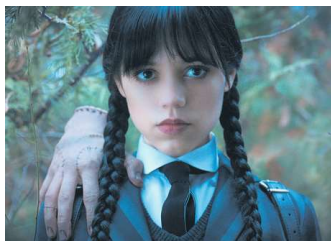
Si j'étais un personnage de série... Parce que...