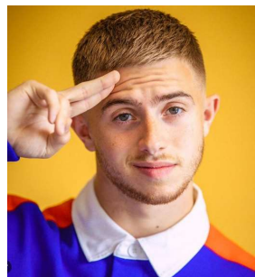
Si j'étais youtuber/youtubeuse... Parce que...