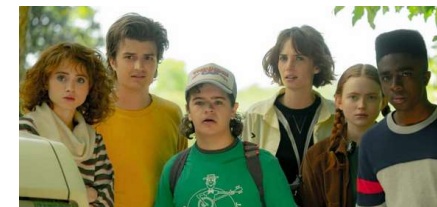
Si j'étais une série... Parce que...