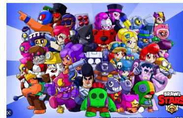
Si j'étais un personnage de jeux vidéo... Parce que...