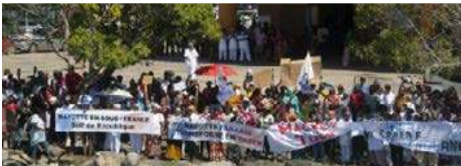
Une centaine de manifestants l'attendaient de pied ferme, à Mamoudzou.

Élisabeth Borne a confirmé que les distributions continueront "aussi longtemps que nécessaire".