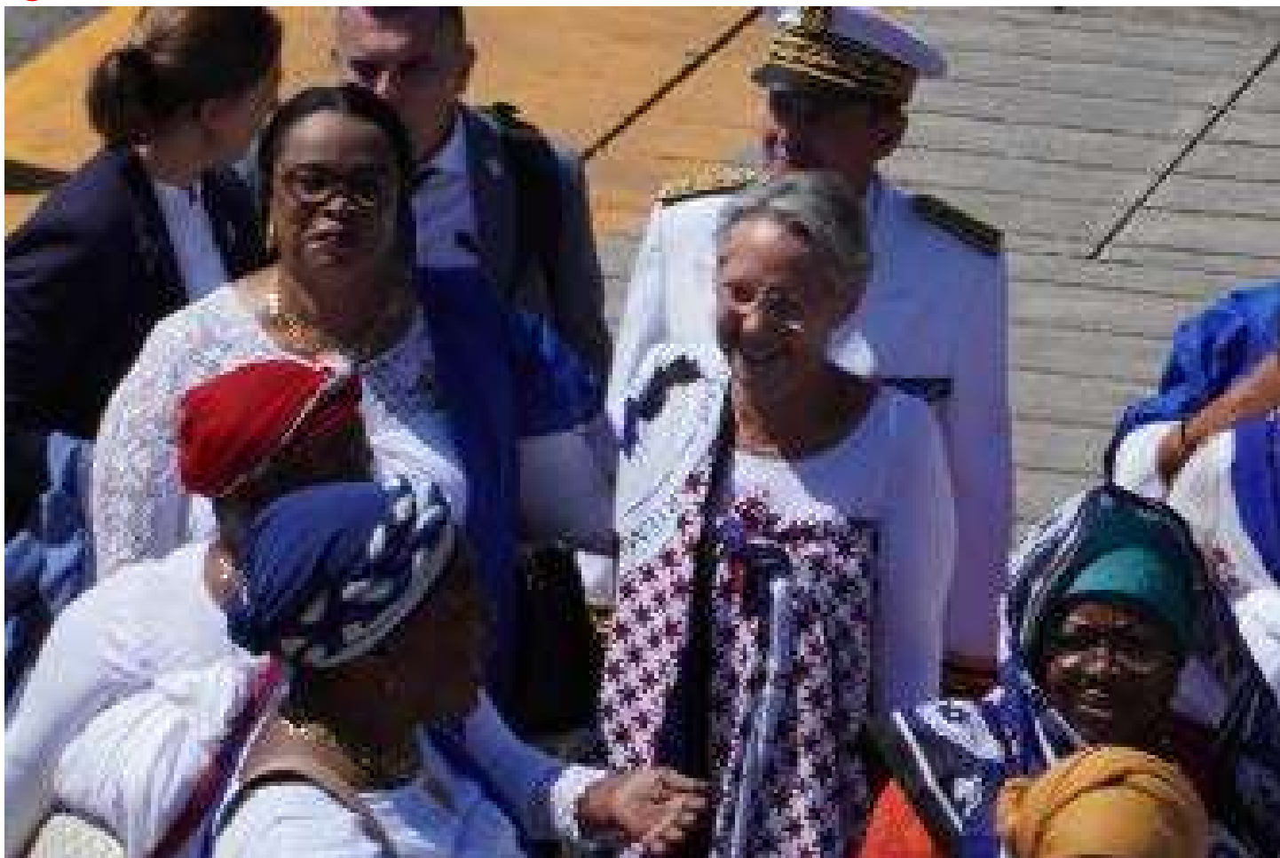
Élisabeth Borne a porté un salouva lors de la traversée vers Grande-Terre.

retenue collinaire à Ourouvéni. Pour la première, elle est toujours annoncée "début 2025". Interrogée sur les difficultés foncières et écologiques du projet, elle a reconnu qu'"aucun des sites n'a aucun inconvénient. A un moment donné, il faut choisir le site avec le meilleur compromis. Les études sont menées pour réduire l'impact environnemental. Il n'y a pas de site idéal". Concernant la retenue collinaire, qui devrait s'ajouter à celles de Comabni et Dzoumogné, elle confirme qu'il y aura une déclaration d'utilité publique "très prochainement". Cette procédure fixe un cap pour les négociations avec les propriétaires fonciers, voire peut entraîner des expropriations.