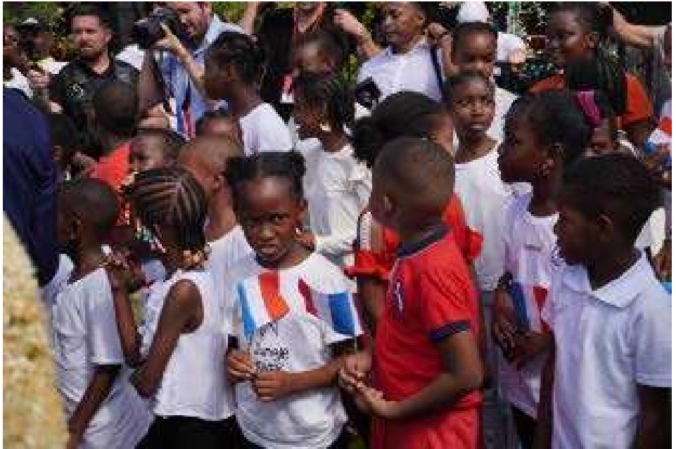
Un comité d'accueil était à l'hôtel de ville de Dzaoudzi-Labattoir, notamment un chœur d'enfants chantant La Marseillaise.