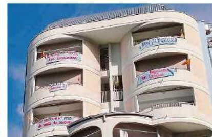
Depuis jeudi dernier, de nombreux messages et slogans fleurissent sur les balcons des locataires des immeubles de la résidence Pointe-Simon, à Fort-de-France.