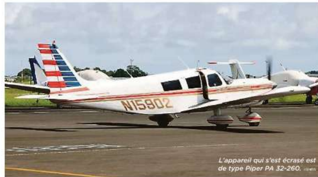
L'appareil qui s'est écrasé est de type Piper PA 32-260.

Au décollage de Terre-de-Haut, en milieu de matinée, l'avion avait disparu des radars vers 10 heures... Il n'avait été repéré que le lendemain samedi dans l'après-midi, au large de Terre-de-Haut à 45 mètres de profondeur, par le Cross AG (Centre régional opérationnel de surveillance et de sauvetage Antilles-Guyane) et les plongeurs du Service départemental d'incendie et de secours (Sdis). Il n'y avait malheureusement aucun survivant.